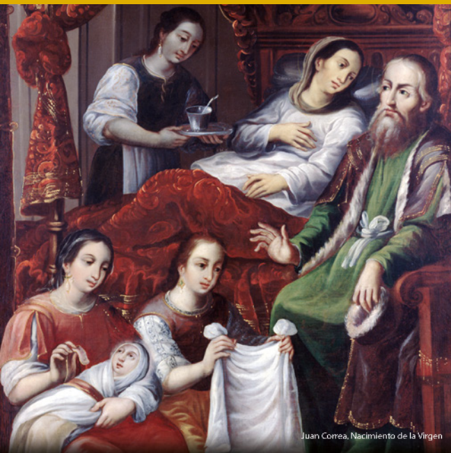
Juan Correa, Nacimiento de la Virgen