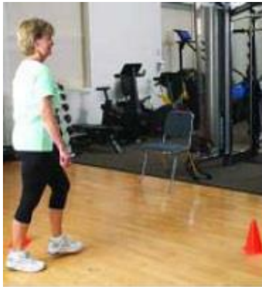
Caminar en circuito de 2 conos