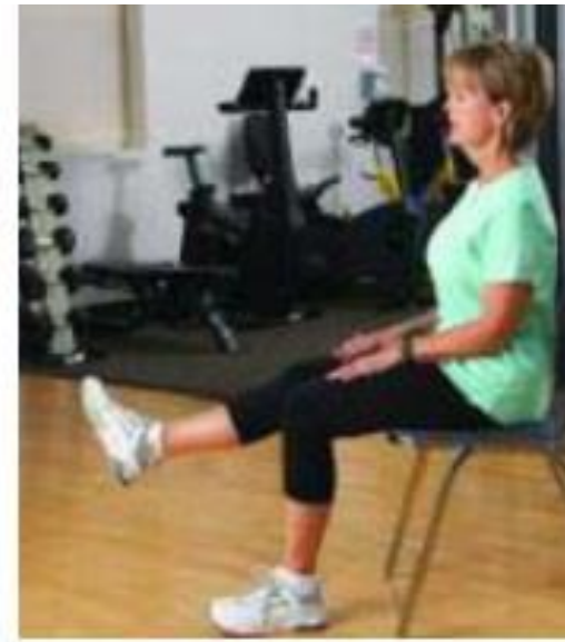
Extensión de Piernas